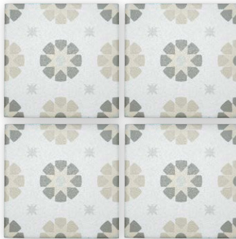
[内装] PM-150/PLS-04 [外装] PM-150/PLS-04G