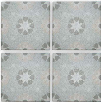
[内装] PM-150/PLS-03 [外装] PM-150/PLS-03G