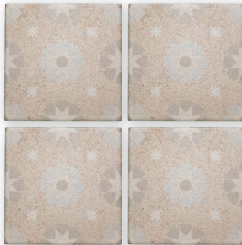
[内装] PM-150/PLS-02 [外装] PM-150/PLS-02G