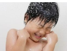
女性や子供が持ちやすい軽量タイプのシャワーヘッド